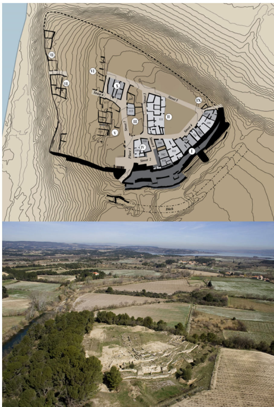
Fig. 1.- Planimétrie et photographie du site.