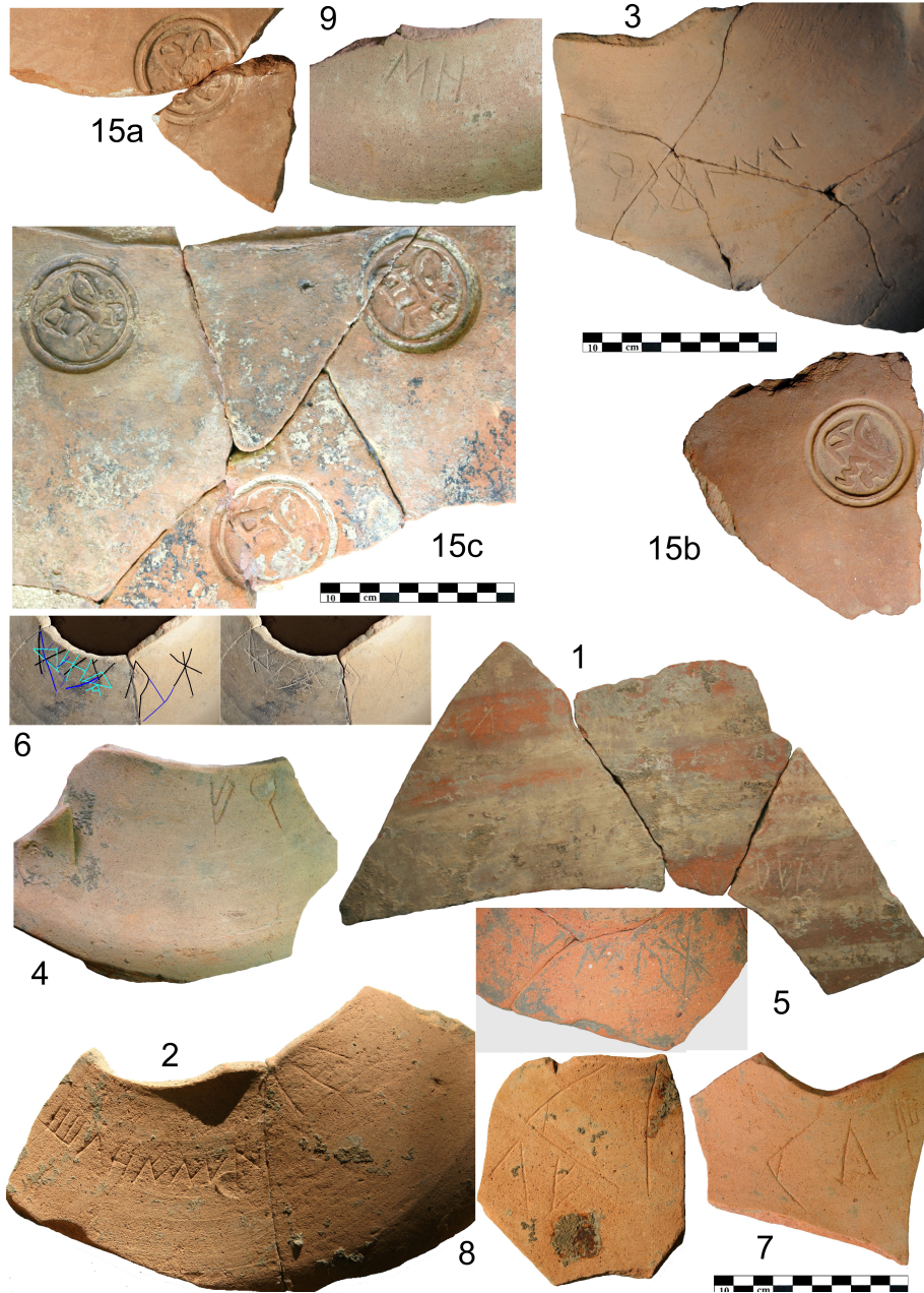
Fig. 2.- Inscriptions sur amphores et dolia .

2.7. Graffite incomplet sur le fragment d'un col d'amphore gréco-italique (12) x (10) cm; signes entre 3,5 / 5 cm. Le texte est écrit dans la variante duale de l'écriture ibérique nord-orientale, à en juger par la présence de la variante complexe de ke et de ti: kelti[---] .