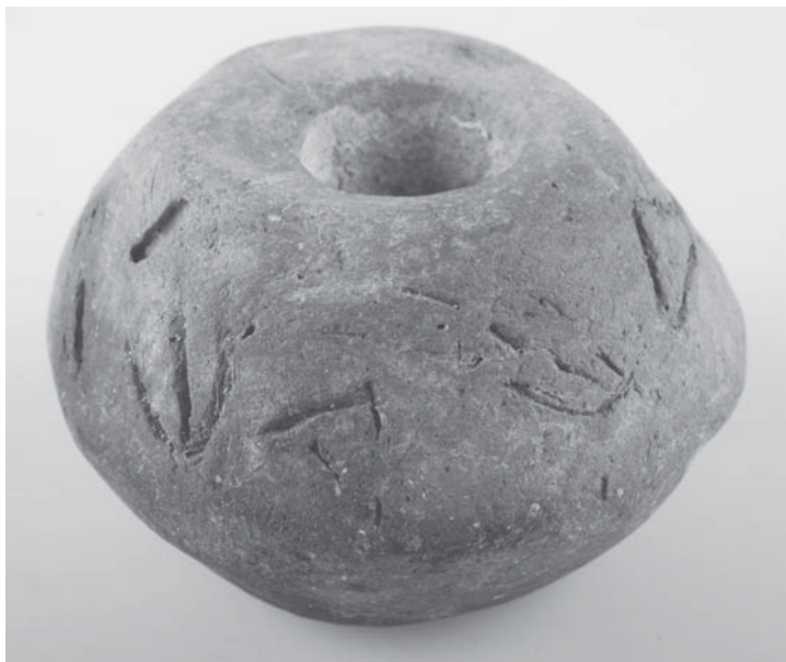
Figs. 4 y 5, detalles de la inscripción de la fusayola de la necrópolis de Las Ruedas de Pintia .